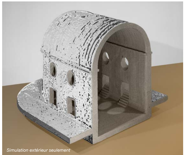
Simulation extérieur seulement