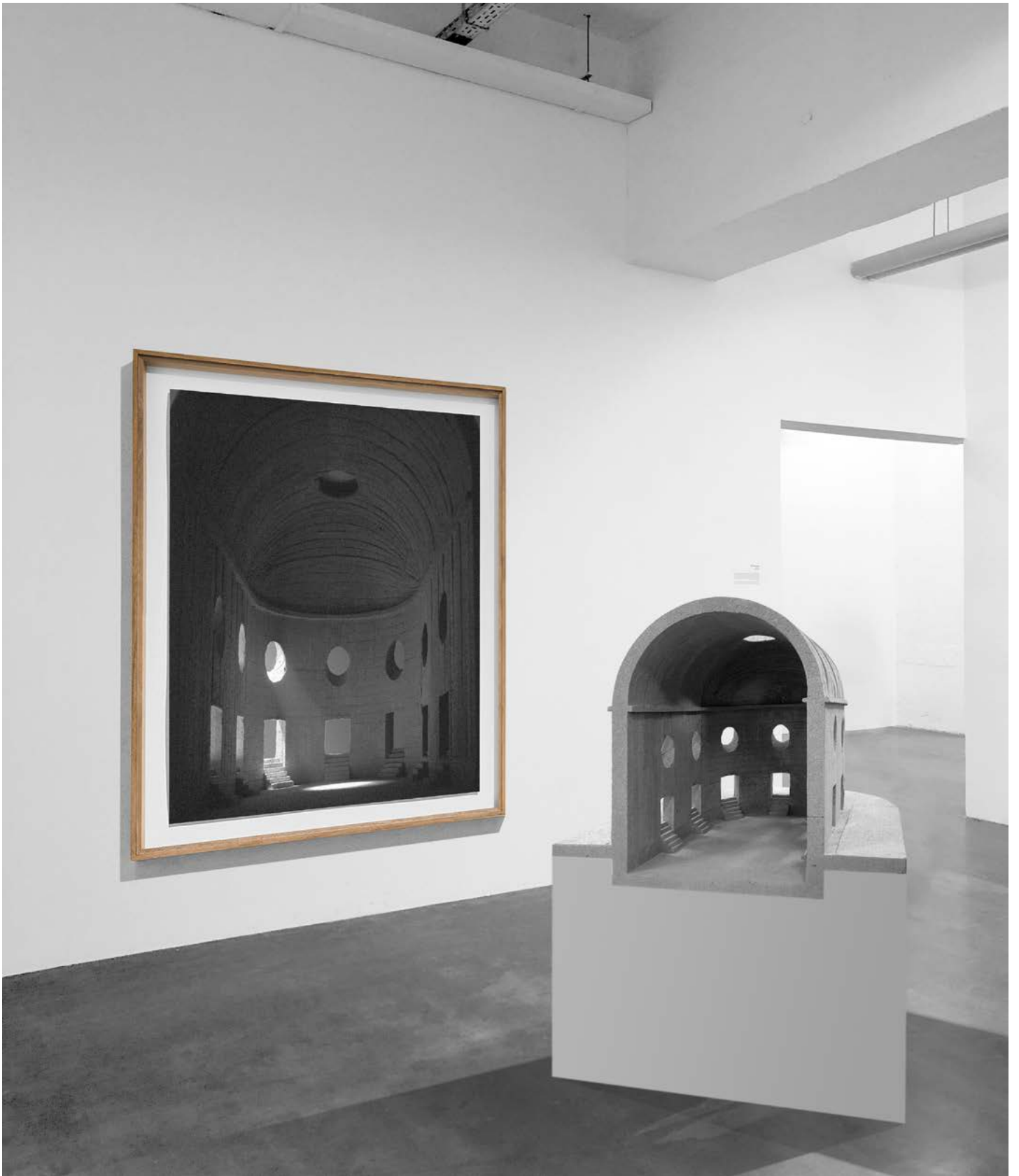
« Memento II » installation Sculpture en béton et Photographie de mise en scène